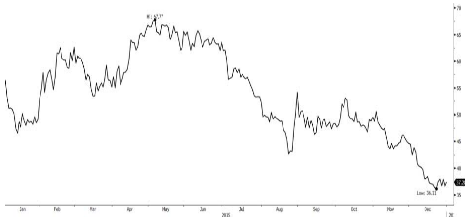
الأداء الربع سنوي لخام برنت