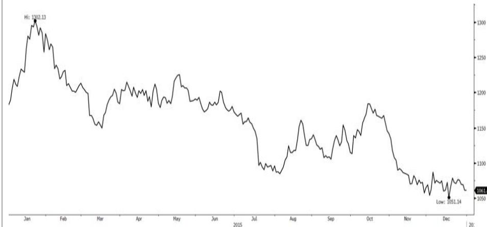
الأداء الربع سنوي للذهب